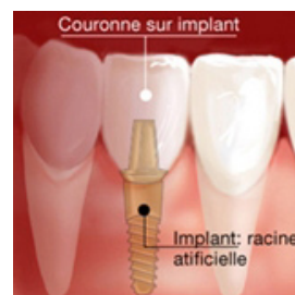
Couronne sur implant dentaire

Le choix d'une prothèse dentaire s'effectue en concertation avec votre chirurgien-dentiste